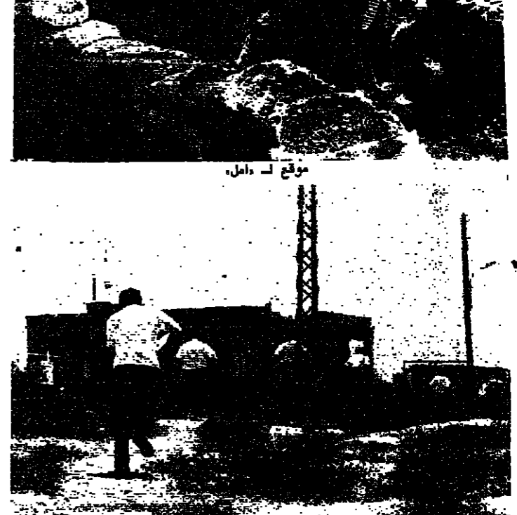
مصابون يهربون بعد تصاعد المعارك